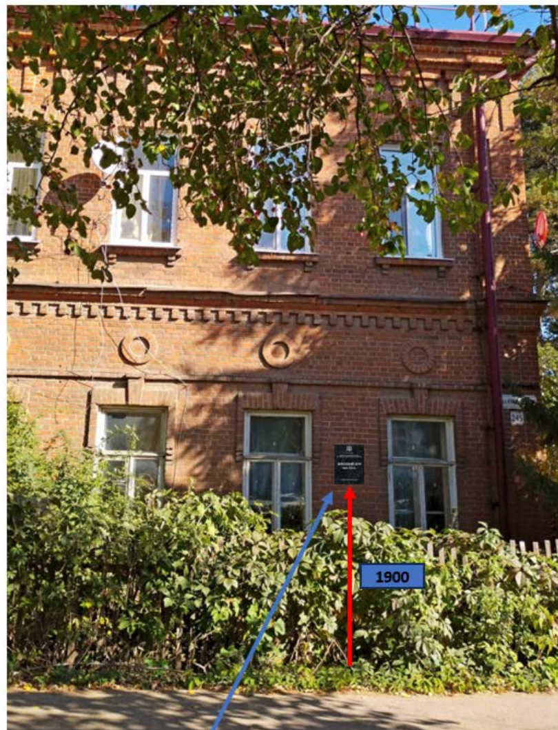
Место установки надписи

Проект на установку информационной надписи и обозначения на объект культурного наследия местного (муниципального) значения