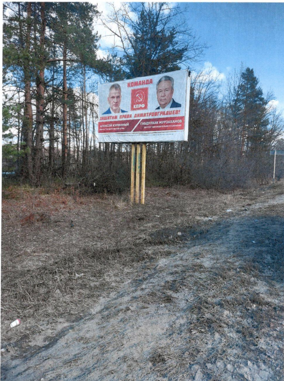
Фото рекламной конструкции